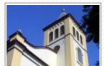
Igreja Matriz de Sant'Anna