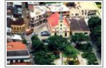
Vista aérea da Praça Sant'Anna