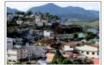
Bairros São João e Bela Vista